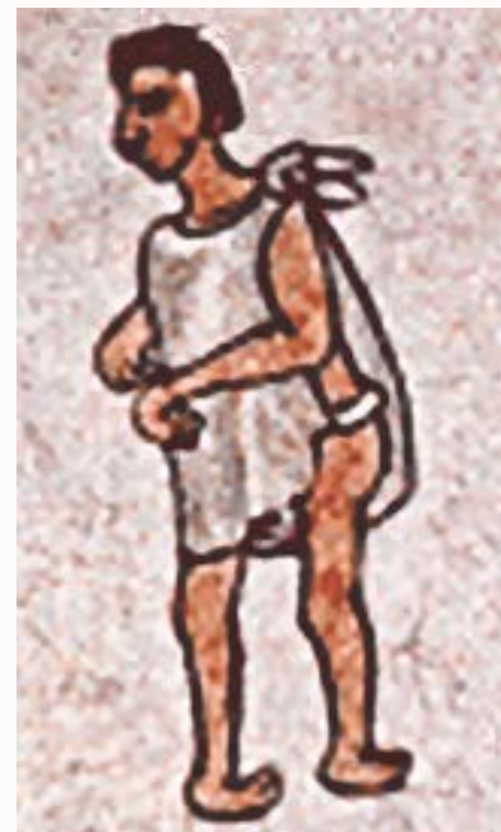
La imagen corresponde al Códice Mendocino y representa a una persona con pies torcidos.

Hoy, en cambio, el mismo CONAPRED afirma que "la principal barrera que padecen las personas con discapacidad es atribuirles que debido a sus características es imposible su integración plena a la sociedad. Esta mentalidad les ha traído consecuencias graves durante generaciones, pues en lugar de que se establezcan las condiciones necesarias para su pleno desarrollo, se les margina y rechaza al marcarlos como incapaces de formar parte de la visión homogeneizante de la normalidad" 4 .