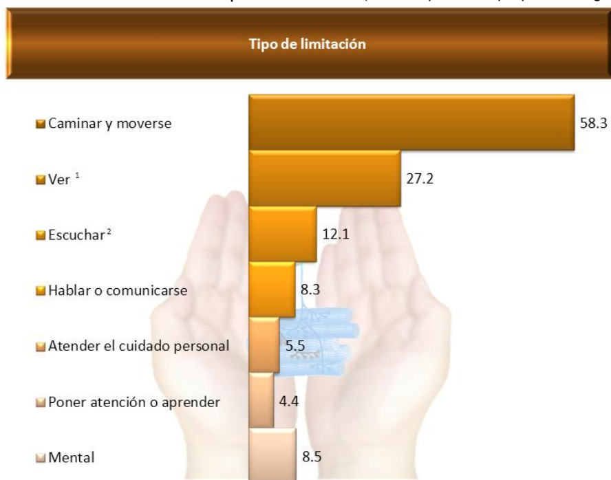
Gráfica 1. Distribución del tipo de limitación (entre las personas que padecen alguna)

1 Incluye a las personas que aun con anteojos tenían dificultad para ver.