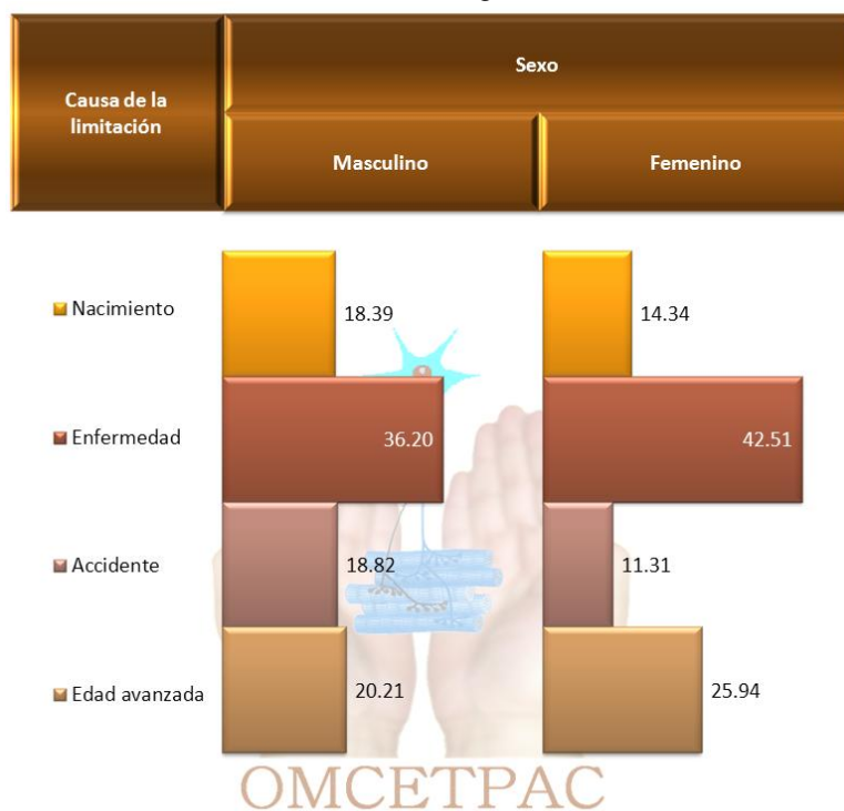
Gráfica 2. Causa de la limitación, según sexo